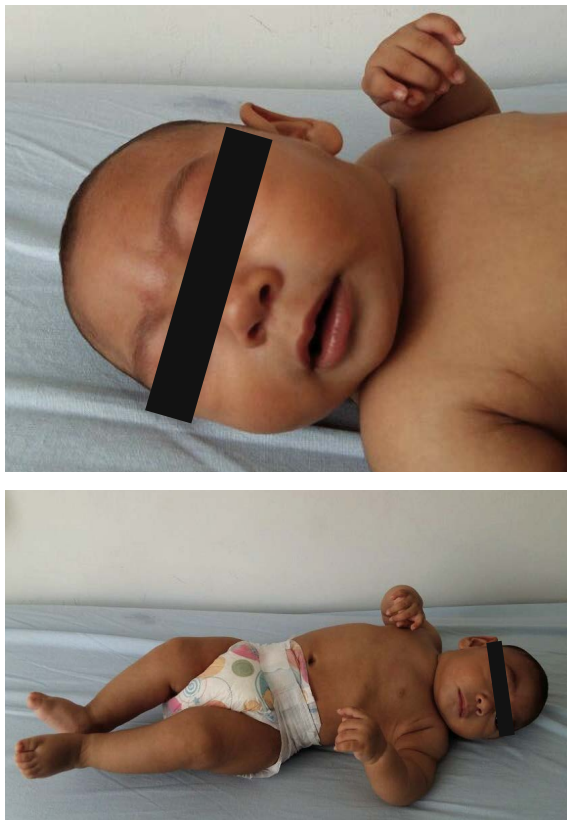
Figura 1. Paciente con A. microcefalia severa y B. hipertonía e hiperreflexia con tendencia al opistótono.